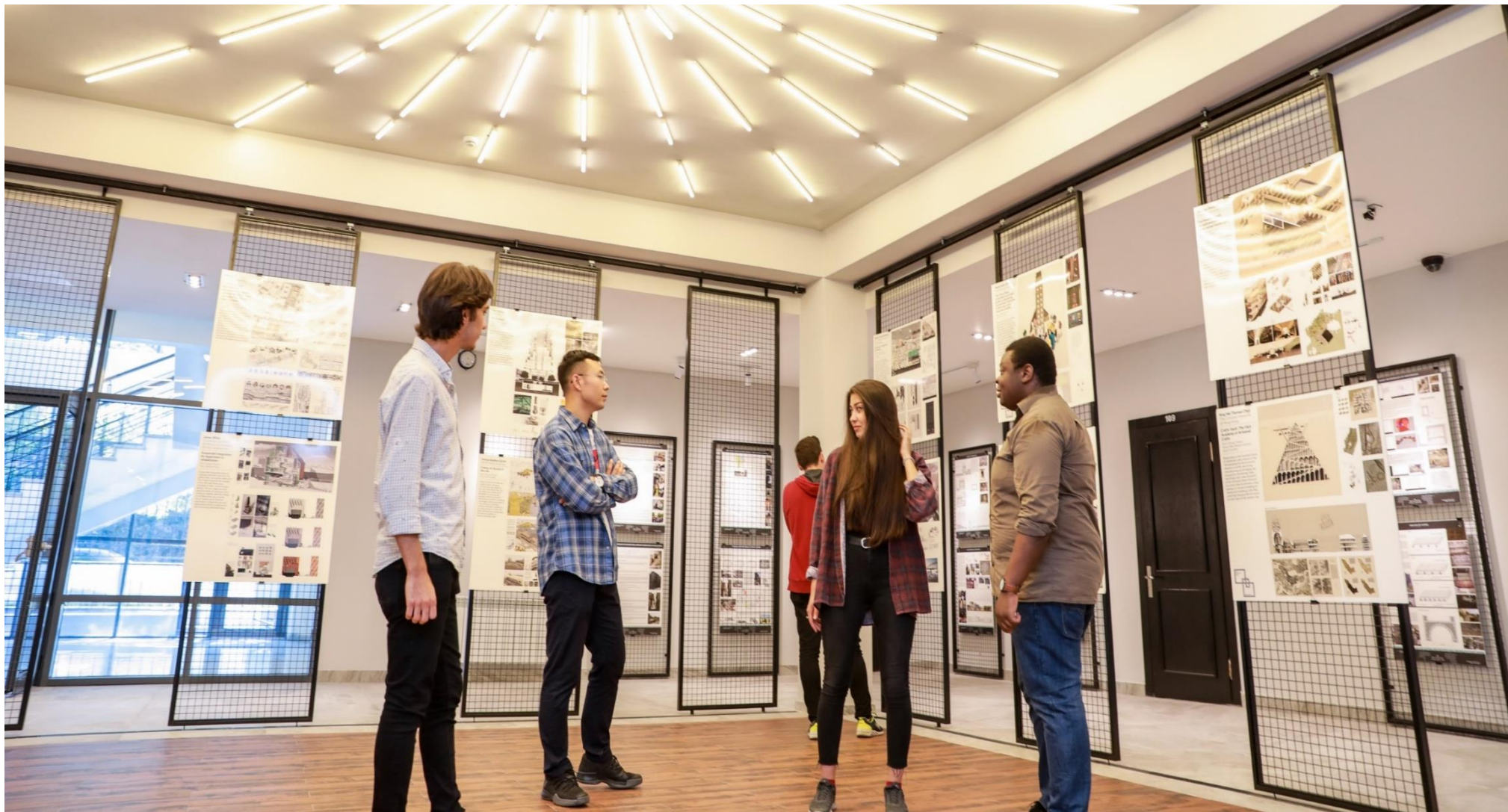
Tələbələr AzMİU-nun yeni Memarlıq korpusunda